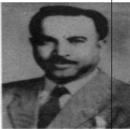
قاضي محمد اكبر